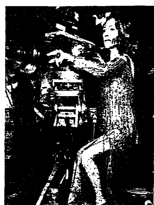
انحياة اليومية من الاثنين الى الجمعة لاربع ممثلات

ابنت مجموعة نقلت من عشر منظومات ، ان النساء يستطعن الاشتراك في ميدان الفضاء ، دون ان تعرضن صحنهن للخطر . وقد خاضت المتطوعات الروسيات تراوح اعمارهن بين ٢٥ و ٤٥ سنة ، سلسلة من الاختبارات طوال ٢٤ يوما في مركز ابحاث وكالسة الفضاء الروسي في مدينة ايسيز بولاية كاليفورنيا . وقال هارولد ستاندر ، المسؤول عن المشروع : اننا ان نجد اي شيء يشير الى ان النساء في هذه المرحلة من العمر لا يمكنهن العمل في مجال الفضاء .